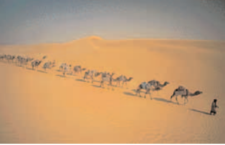
A.M. ATAY / MALI SAHRA ÇÖLÜ